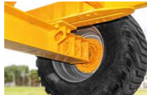
EJE TRASERO | PUNTAS DE EJE

Accionados mediante toma de fuerza del tractor (PTO). Los mixers horizontales cuentan con transmisión con Reductor Epicicloidial (RE), lo cual los hace o muy eficientes, seguros y tecnológicos.