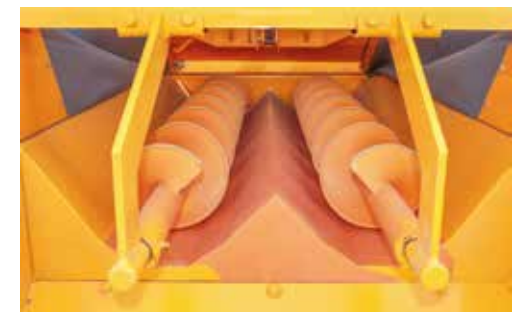
SISTEMA DE DESCARGA

NOTA: Para procesar en la Ración Totalmente Mezclada (TMR), con fibra larga desmenuzada, estos modelos RE pueden transformarse en modelos RE CUT, con lo cual adquieren una versatilidad excelente.