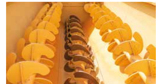
CUBA INTERIOR: 3 SINFINES