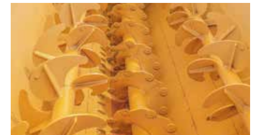
CUBA INTERIOR: 3 SINFINES