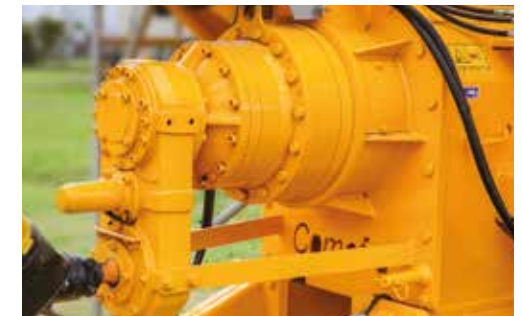
ÁRBOL ENTRADA DE POTENCIA