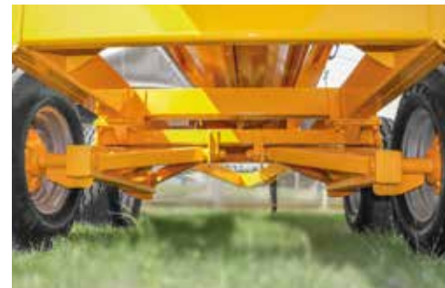
EJE TRASERO | PUNTAS DE EJE

Aplicación de balanzas electrónicas de carga.